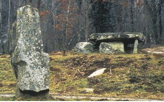
Dolmen et menhir de Mârdeix