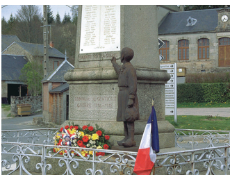
Monument aux Morts de Gentioux

La seconde guerre mondiale ravive la tradition d'opposition des Creusois. Les maquis s'organisent en amplifiant leurs actions au début de 1943. La Creuse se libère seule les 24 et 25 juin 1944. De modestes plaques, ou des monuments plus importants, témoignent de cette histoire récente le long des routes du département. Parmi ceux-ci, le monument de Gentioux se détache ; unique en France, jamais inauguré officiellement, il représente un enfant qui tend le poing vers la liste des disparus et comporte l'inscription « Maudite soit la guerre ».